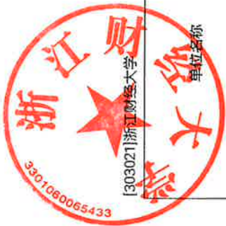
2021年省级部门项目支出预算表